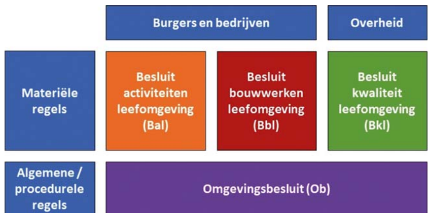
Figuur 1.1: De indeling van de AMvB's

De indeling van de AMvB's naar doelgroepen en type regels is gevisualiseerd in figuur 1.1.