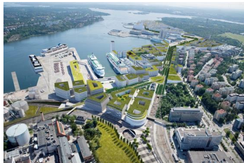
Stockholm Royal Seaport

19.30 uur Avondwandeling van hotel via het historische stadseiland Gamla Stan naar restaurant.