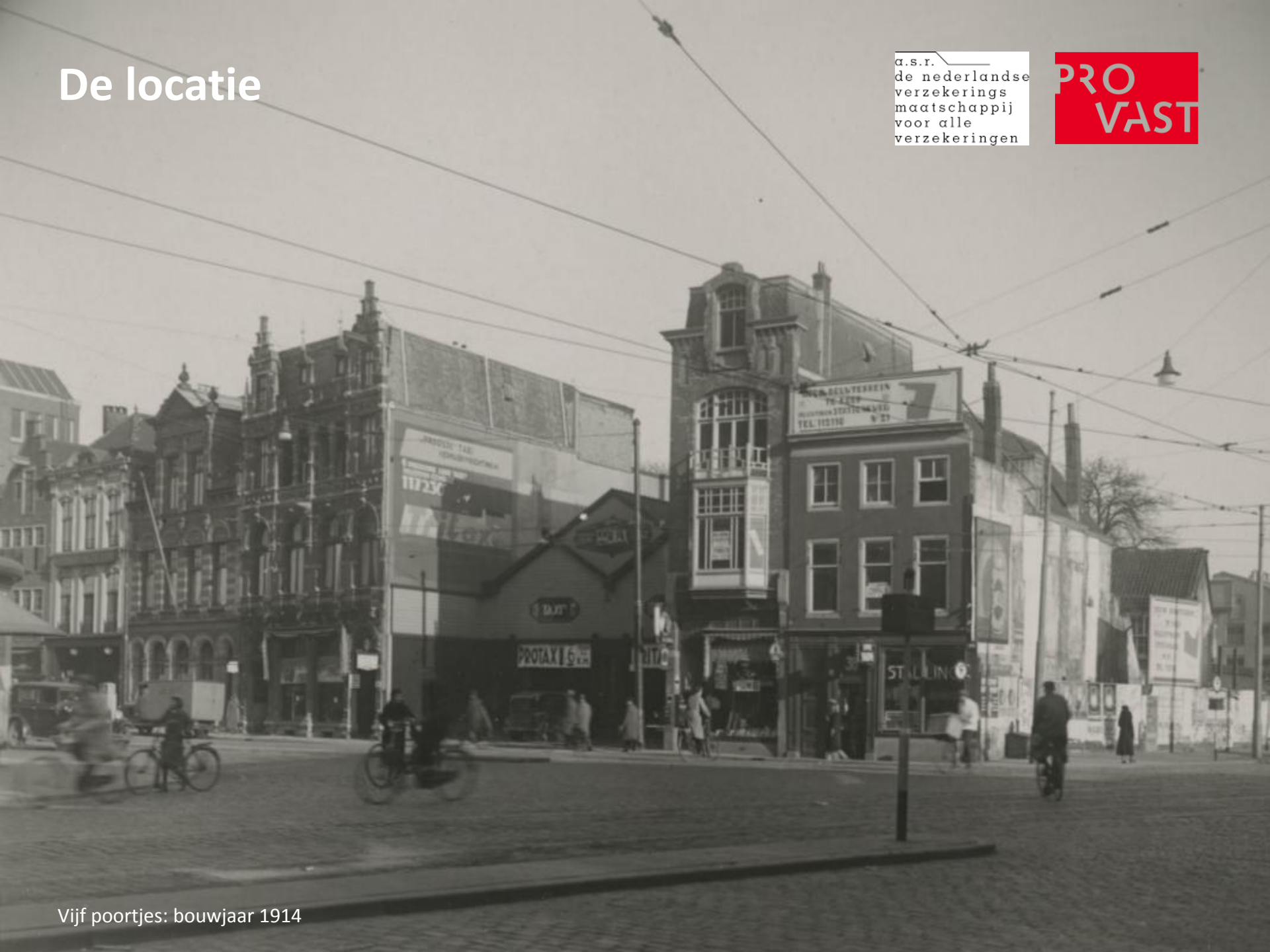
Vijf poortjes: bouwjaar 1914