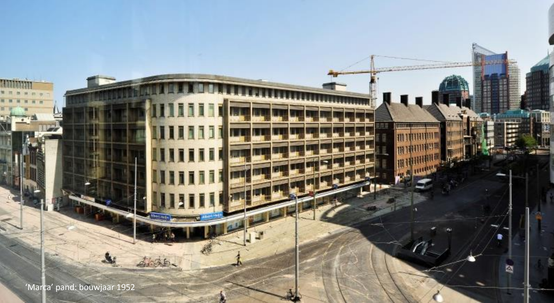
'Marca' pand: bouwjaar 1952