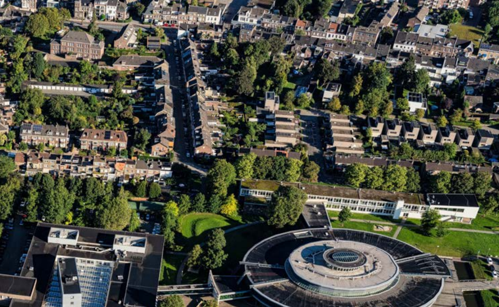
▲ De Groene Loper, Maastricht