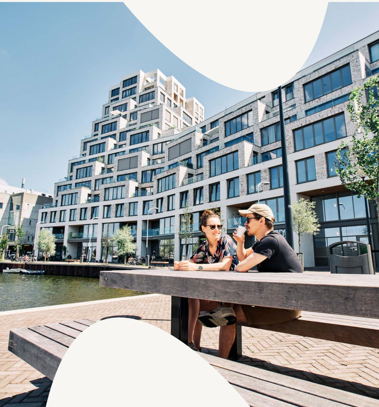
Cruquius, Amsterdam – winnaar NEPROM-prijs 2024